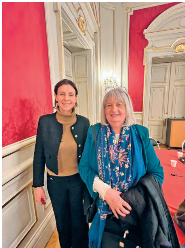
En présence de Mme Charlotte Parmentier-Lecocq, ministre chargée de l'autonomie et des personnes handicapées jusqu'au 26 février 2026

Enfin, les initiatives menées dans nos établissements et les temps forts comme le Trophée de l'Espoir, témoignent de notre attachement à des valeurs fortes : solidarité, inclusion et innovation.